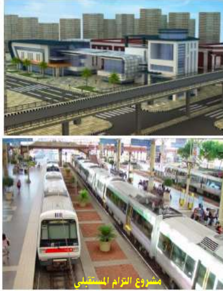
مشروع الترام المستقبلي