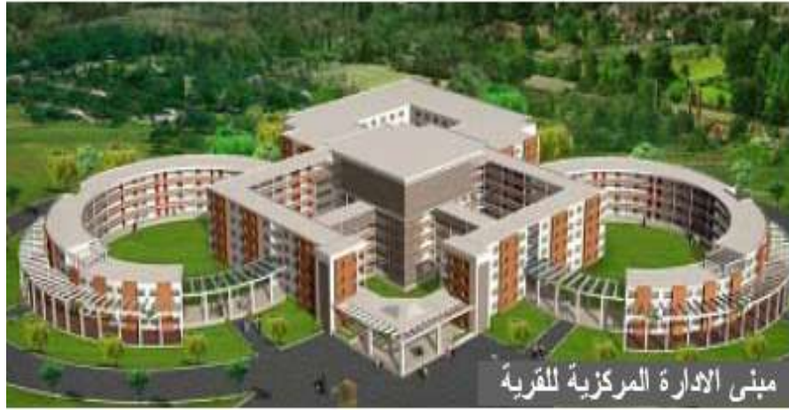
مبنى الإدارة المركزية للقرية