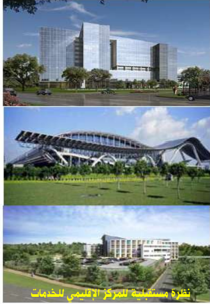
نظرة مستقبلية للمركز الإقليمي للخدمات